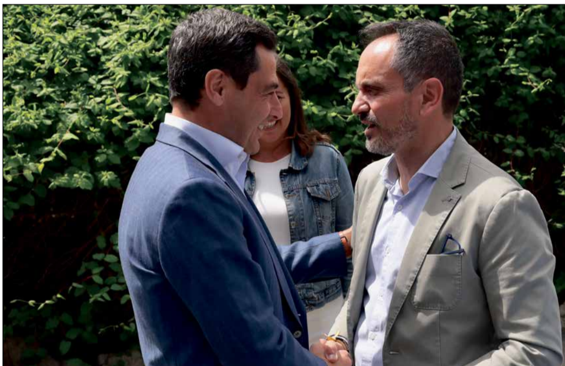
El presidente de la Junta de Andalucía, Juanma Moreno, junto al candidato del PP a la Alcaldía, Manuel Bautista