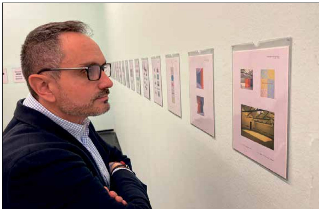
Manuel Bautista, candidato del PP a la Alcaldía de Móstoles